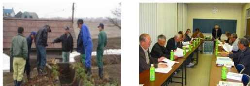
施設点検 年度活動計画の策定