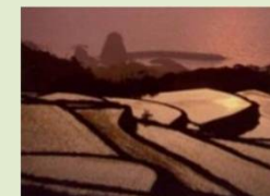
中山間地域 (山口県長門市)

中山間地域等の条件不利地域（傾斜地等）と平地とのコスト差（生産費）を支援します。