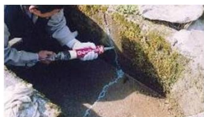
水路のひび割れ補修