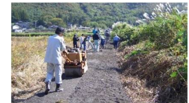
未舗装の農道をアスファルトで舗装