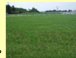
カバークロップ (緑肥)の作付