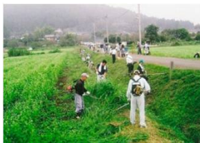
農地法面の草刈り