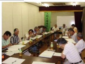
組織運営に関する研修