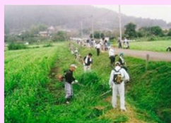
農地法面の草刈り