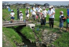
生き物調査による啓発