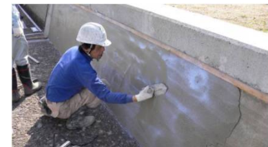
老朽化した水路壁のコーティング