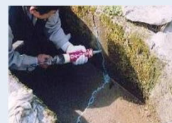
水路のひび割れ補修